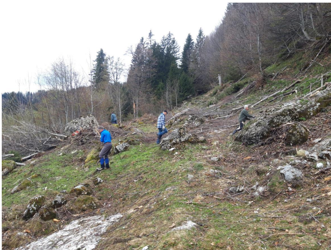
Arbeitseinsatz am Freiwilligentag 2019