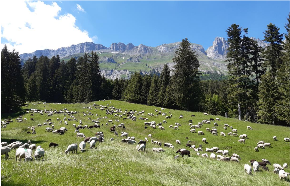
Schafe auf der Vorweide Suweid