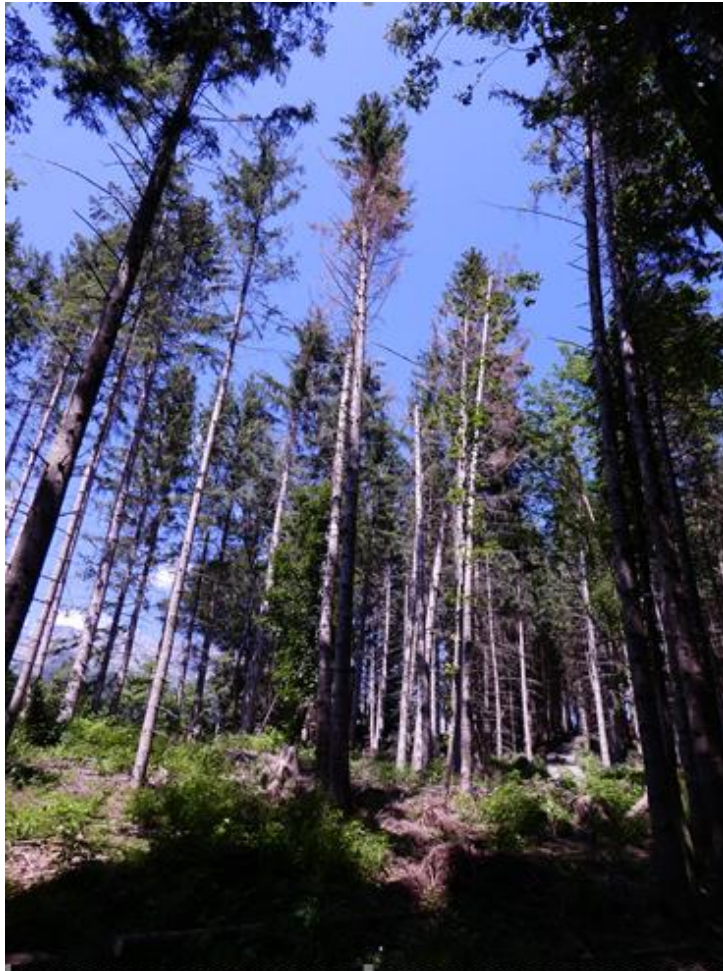
Junge Fichten, in einem vom Borkenkäfer befallenen Waldbestand