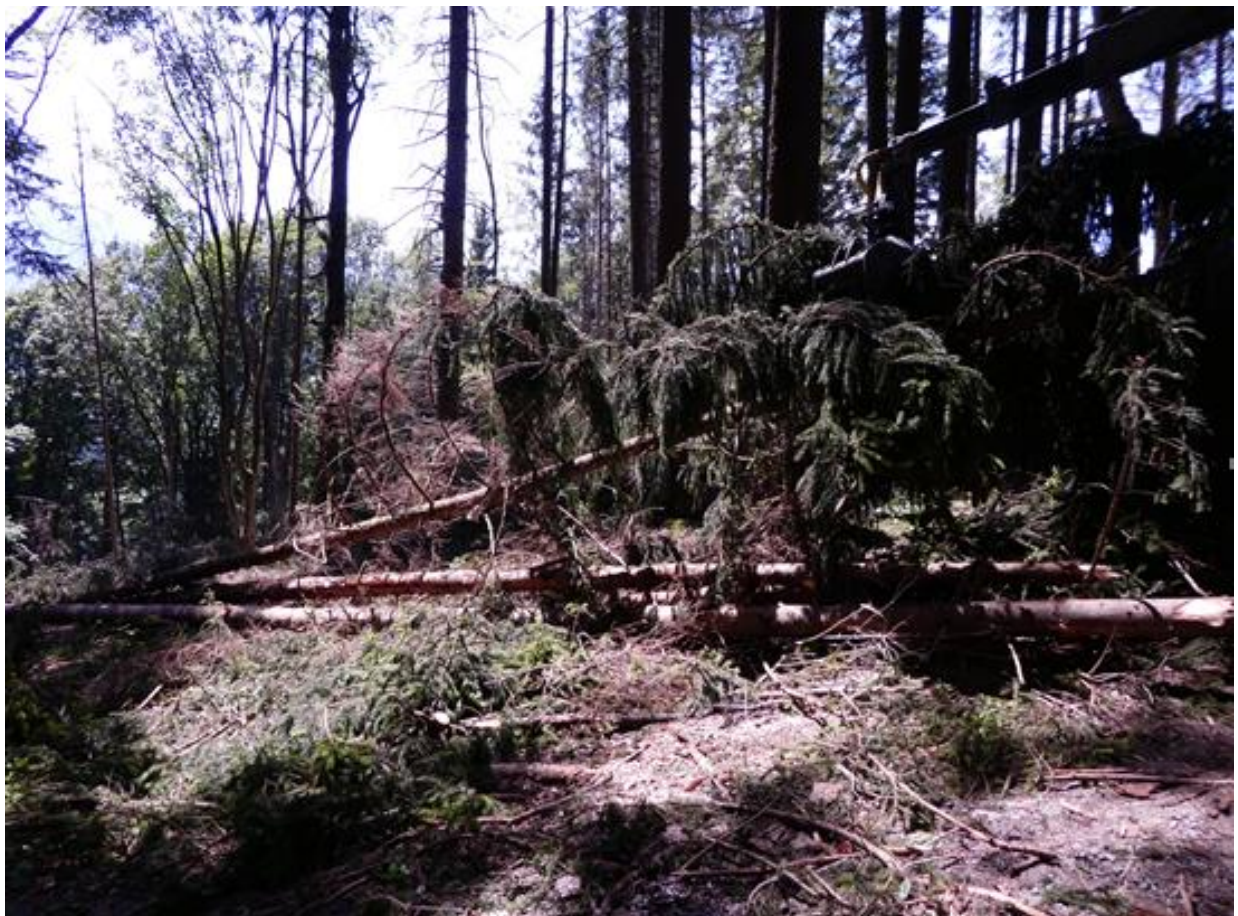
Aufrüsten von Borkenkäfer befallenen, noch jungen Fichten.

Die Waldbewirtschaftung ist unter diesen Umständen schwierig, zeit- und kostenintensiv. Als Waldbesitzer sind wir aber trotzdem in der Pflicht, auch der zukünftigen Generation, einen intakten Wald zu hinterlassen. Dies wird uns aber nur mit kleineren Reh- und Rotwildbeständen, dem Einsatz von mechanischem Schutz von Pflanzen, durch gemeinsame und unbürokratischer Zusammenarbeit zwischen Waldbesitzern, Forst und Jagd und mit der Unterstützung von den zuständigen Ämtern gelingen.