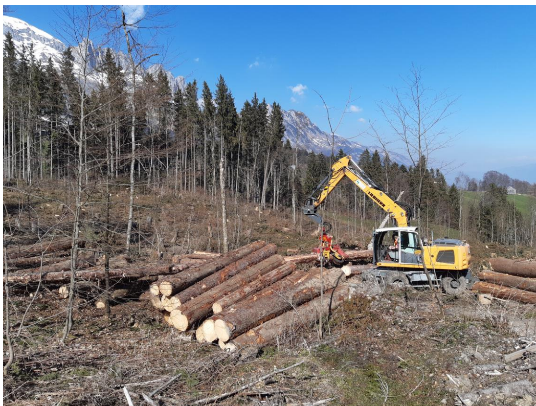
Prozessor im Einsatz bei den Aufrüstarbeiten

Die Coronakrise wird mit grosser Wahrscheinlichkeit auch die Waldwirtschaft nicht verschonen. Erste Erkenntnisse zeigen, dass Exporte nach Italien nicht mehr möglich sind. Mit dem aktuellen Holzanfall aus Zwangsnutzungen, werden wir aufgrund der ungewissen wirtschaftlichen Lage, auf Normalnutzungen vorab verzichten, ausser es wird vom Markt verlangt.