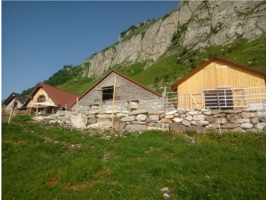
Rechts: neuer Tiefstreustall mit Auslauf und Strohlager auf Alp Obetweid

Bis zum Alpbeginn konnte der neue Tiefstreustall und das Düngerlager fertiggestellt und somit seiner Funktion übergeben werden. So bietet diese neue Stallung den Alptieren guten Schutz vor Hitze und Ungeziefer.