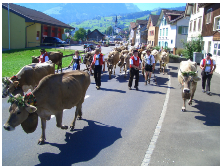
Traditionelle Tesler Alpabfahrt, wo Kulturen zusammenkommen

Der Herbst hat mittlerweile Einzug genommen und die Tiere auf den Gamser Alpen sind seit dem 13. September allesamt in ihre angestammten Heimbetriebe zurückgekehrt. Die Höhepunkte der Alpabfahrten setzten die Alpen Tesel und Abendweid, welche in traditioneller sennischer Art ihre Heimkehr angetreten haben (Abendweid bis Schwendi, Tesel bis Dorf Gams). Der Ortsverwaltungsrat unterstützt den traditionellen Alptrieb sehr und erfreut sich umso mehr an der Bereitschaft der Älpler diesen Aufwand auf sich zu nehmen und dieser schönen Tradition zu frönen.